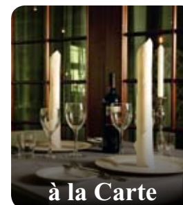
à la Carte