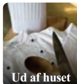
Ud af huset